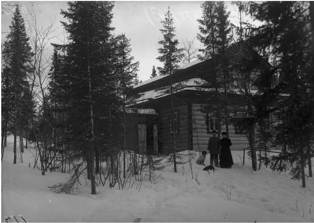
Организатор питомника пушных зверей в Ширше Розен с женой Съёмка – 1907 г.