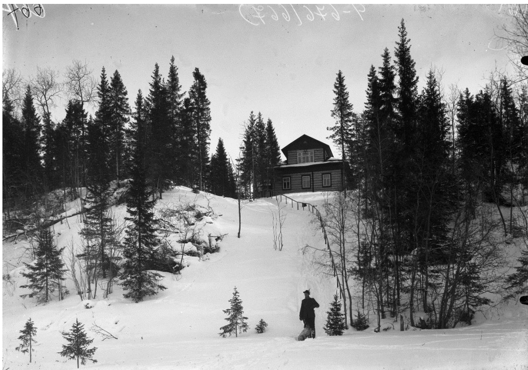
Дом заведующего питомником пушных зверей в Ширше Съёмка – 1907 г. Автор съёмки – Поплавский А.А. Фото из фондов ГААО