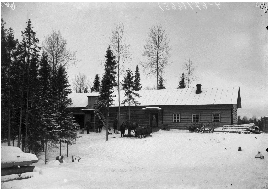
Надворные постройки питомника пушных зверей в Ширше Съёмка – 1907 г.