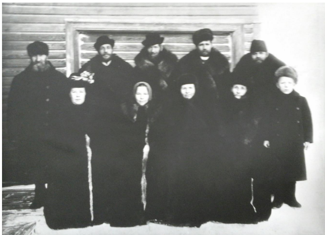
Жители д.д. Ширша и Исакогорка. Прим. 1910 г., из фондов Музея народных промыслов и ремесел Приморья