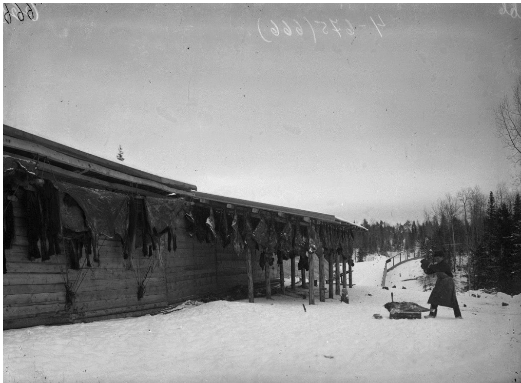
Хранение продуктов питания для зверей в питомнике пушных зверей в Ширше Съёмка – 1907 г.